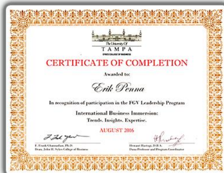
Curso sobre Liderança com a Universidade de Tampa em Florida/USA