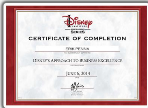
Curso sobre Gestão de Excelência com o Instituto DISNEY em Orlando/USA