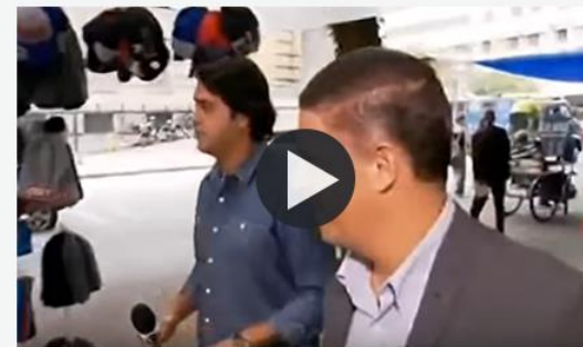
PROGRAMA PROFISSÃO REPÓRTER